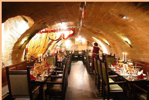
Großes Gewölbe im Sophienkeller

Am Abend ist eine historische Stadtführung für uns reserviert. Hier entführt uns Schankmagd Mathilda in die atemberaubende Dresdner Altstadt der sächsischen Residenz. Bei einer Vorspeise im Pulverturm, einer Weinverkostung an der Frauenkirche schließen wir den Abend mit einem reichhaltigen Abendessen im Sophienkeller ab.